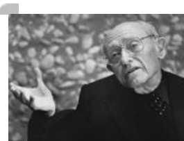
Der Komponist Josef Tal.

Als Komponist und Erzähler ist Tal Grafiker. Jedes Erinnerungsbild wird Linie. Die Summe aller Linien ergibt ein Leben. Dessen Anfang liegt in Berlin. Dreh- und Angelpunkte dort sind Musikhochschule und rabbinisches Elternhaus, sprich: Judentum und Moderne - nicht als „deutsch-jüdische Symbiose“, wie trotz Gershom Scholems klarem Widerspruch die Verklärungsformel weismachen will. Denn wo schneiden sich Parallelen? Allenfalls im „unendlichen“ Augenblick, wie ihn Josef Tal alias Gruenthal tatsächlich in einer Kindheitserinnerung aus den frühen zwanziger Jahren bewahrt hat.