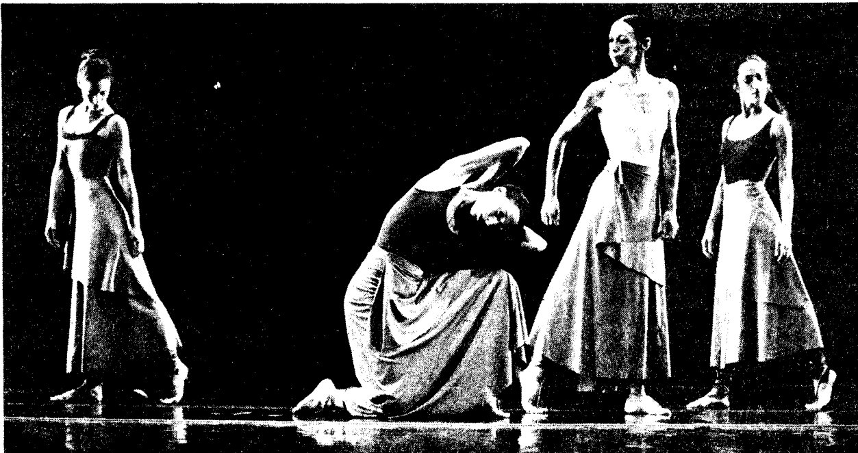
A scene from the Batsheva Dance Company's "Recollections of a People."