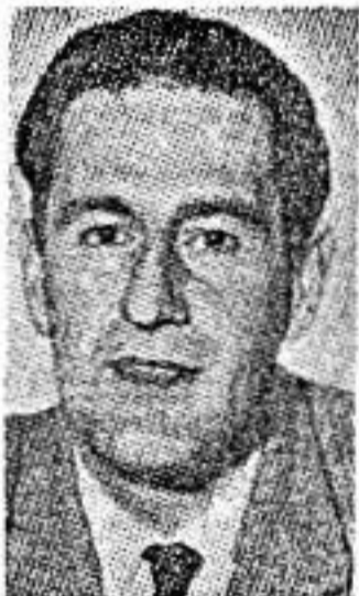
גיאן קרלו מנושי שתי הגנות נוספות

נוסף לקונצרטים למנויים יגיש האנסמבל (המונה, בדרך כלל, כ"ס 30 נגנים) תכניות קאמריות (4-12 נגנים), קונ"צרטים מודרכים לפי נושאים, "ערב באך". מחזור קונצרטים לפסנתר (בביצוע פרנק פלג), וקונצרט של מוסיקה ישר"אלית. כן יגיש האנסמבל שתי פרודוקציות גדולות מן ה"י