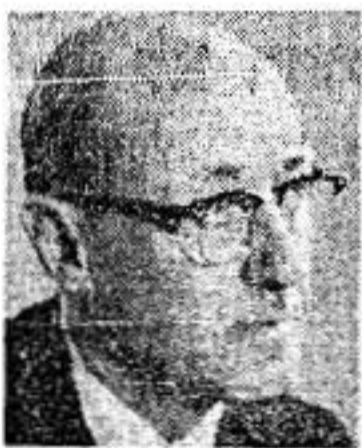
מלהיין טל "מצדה" לא תיפול

למדות הביקורות ותגובת הקהל על "ירושלים", ממשיכה רחה פריאר בהכנותיה * הובטח לה תיאטרון למרגלות ראדיו וטלוויזיה בחול