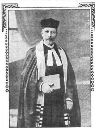
פוב לודות לה גלמר לשמך עליו:

שירות ציני: SCHIR AUS ZWI GOTTESDIENSTLICHE GESANGE DER ISRAELITEN