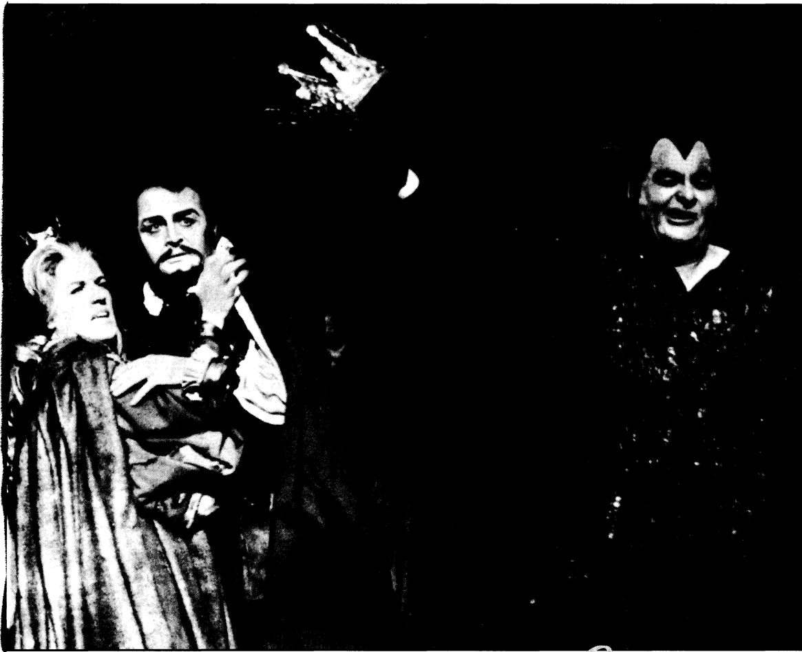
אשמדאי - סצנה אחרונה. הפקת בית האופרה מהמבורג, במאי ליאופולד לינדברג מנצח גארי ברתיני

ברגע שהמאזין קיבל אותה. אם הוא בכלל לא מקבל אותה אז לא גמרתי אותה, שהרי בשביל מי אני כותב?