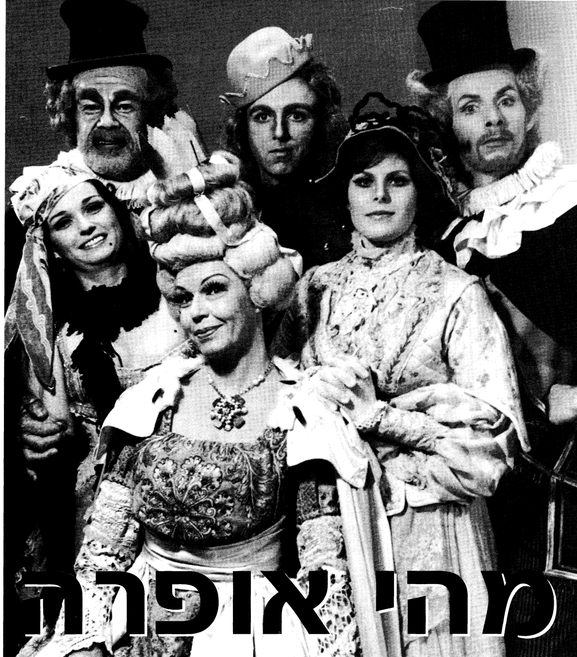
אשמדאי אופרה מאת יוסף טל וישראל אלירז - תמונה קבוצתית בהפקת בית האופרה מהמבורג.